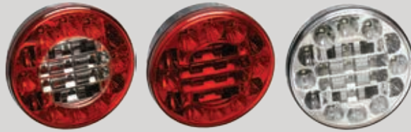
LED Heckleuchte 3 & 2 Funktionen