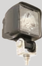
LED Arbeitsscheinwerfer 800 Lumen