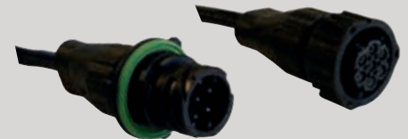
7 Polig AMP 1.5 Stecker