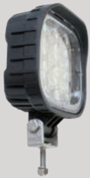
LED Arbeitsscheinwerfer 1800 Lumen