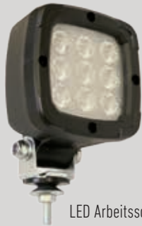
LED Arbeitsscheinwerfer 1300 Lumen