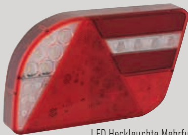
LED Heckleuchte Mehrfunktion